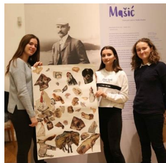
Učenice Gimnazije Dubrovnik, Animalistički motivi u opusu N. Mašića, kolaž

- Edukativni program radionica naslovljen Škola u bolnici, započet 2015. godine, nastavljen je i tijekom 2018. te je – u suradnji s KBC Rebro i učiteljem Igorom Ankonom - ostvaren u prostoru bolnice predviđenom za edukativne sadržaje namijenjene djeci i mladima. Tijekom školske godine jednom do dva puta mjesečno organiziran je pedagoški program koji putem Power Point prezentacije približava sadržaje MG hospitaliziranoj djeci, a kako bi ih se zainteresiralo da se likovno i kreativno izraze osmišljeni su raznovrsni pristupačni zadaci. Cilj ovakvog programa je probuditi zanimanje za modernu hrvatsku umjetnost, potaknuti i angažirati djecu i mlade da kreativno iskoriste vrijeme boravka u bolnici te da otkriju svoju eventualnu darovitost za crtanje ili modeliranje pod mentorstvom muzejske pedagoginje Iris Poljan i učitelj Igora Ankona. Sveukupno je izvedeno: 10 radionica