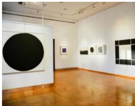
S postava izložbe Mladena Galića u MG

- 5. Naziv izložbe: Matko Mijić / Retrospektiva