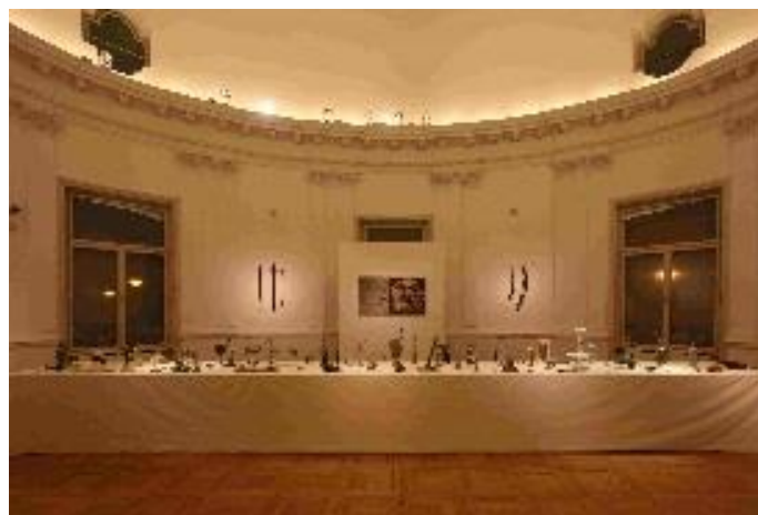
S postava izložbe Matka Mijića u MG: „Stol dok smo čekali“, instalacija iz 2018.

- 6. Naziv izložbe: Nikola Mašić / Plemeniti realist.