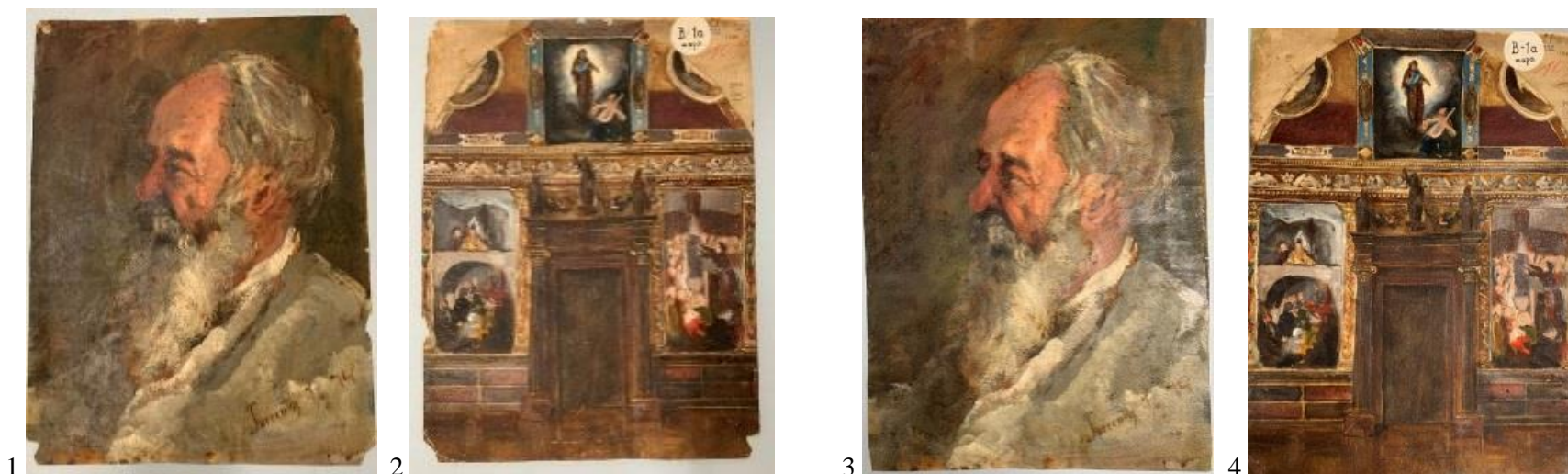
Stanje prije i poslije restauracije slike Ise Kršnjavija, MG-1949

- U povodu izložbe: Nikola Mašić, Plemeniti realist (posebna izložba u MG) tijekom 2018. izvedeni su konzervatorsko-restauratorski radovi na sljedećem nizu djela: