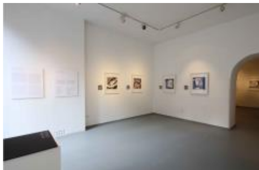
S postava izložbe Petra Barišića u Studiju MG