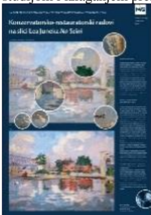
Plakatna studija tijekom zahvata