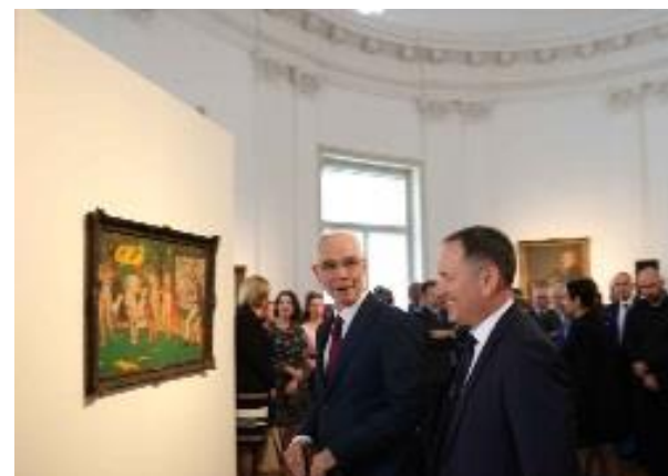
Mađarski ministar ljudskih resursa dr. sc. Zoltán Balog na otvorenju izložbe J. Rippl-Ronay u MG