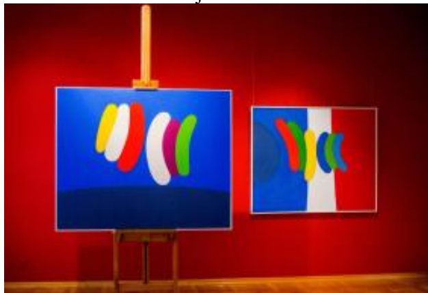
S postava izložbe Mladena Galića u MG