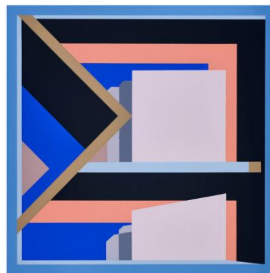
Petar Barišić, Iz bijelog, serigrafija, 2018.

- 13. Naziv izložbe: Nikola Vrljić / Odbjegli